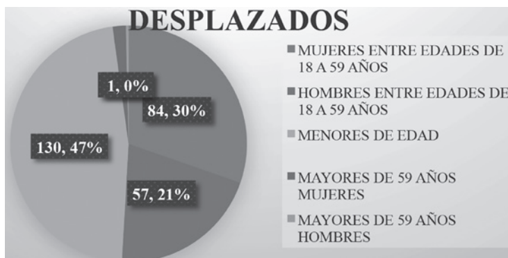
Gráfica 2. No desplazamiento