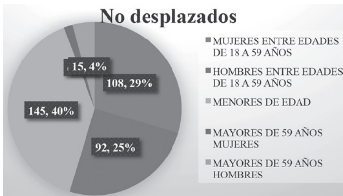
Grafica 3. Población general

Fuente: elaborado por grupo investigador.